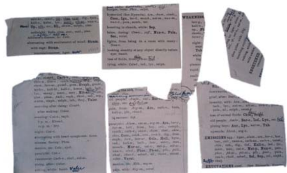
Zerschnitte „Schnipsel“ aus Kents Original